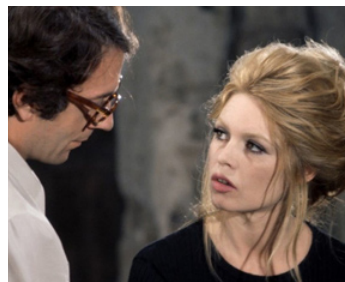
1969 L'OURS ET LA POUPÉE de Michel Deville avec Jean-Pierre Cassel