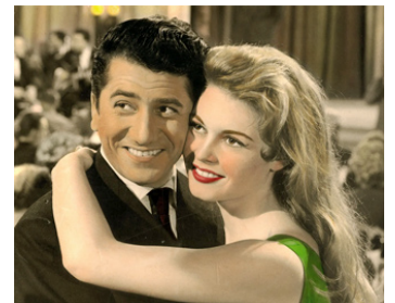
1956 EN EFFEULLANT LA MARGUERITE de Marc Allégret avec Daniel Gélin