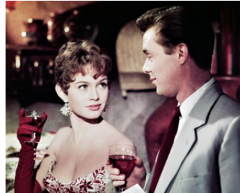
1955 RENDEZ-VOUS À RIO (Doctor at Sea) de Ralph Thomas avec Dirk Bogarde