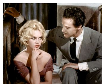
1958 LA FEMME ET LE PANTIN de Julien Duvivier avec Antonio Vilar