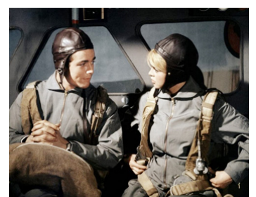
1958 BABETTE S'EN VA-T-EN GUERRE de Christian-Jaque avec Jacques Charrier