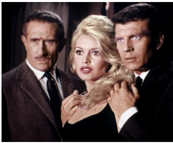
1959 VOULEZ-VOUS DANSER AVEC MOI ? de M. Boisrond avec N. Roquevert, Henri Vidal