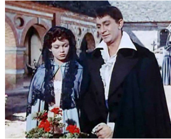
1954 LE FILS DE CAROLINE CHÉRIE de Jean Devaivre avec Jean-Claude Pascal