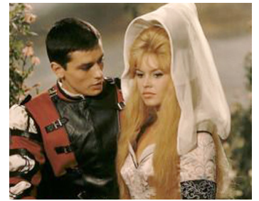
1961 LES AMOURS CÉLÈBRES, Agnès Bernauer de Michel Boisrond avec Alain Delon