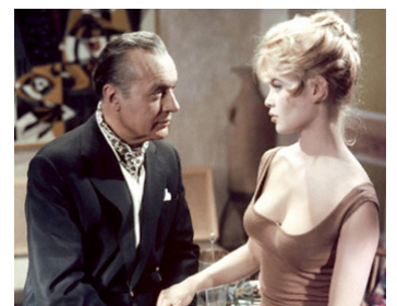
1957 UNE PARISIENNE de Michel Boisrond avec Charles Boyer