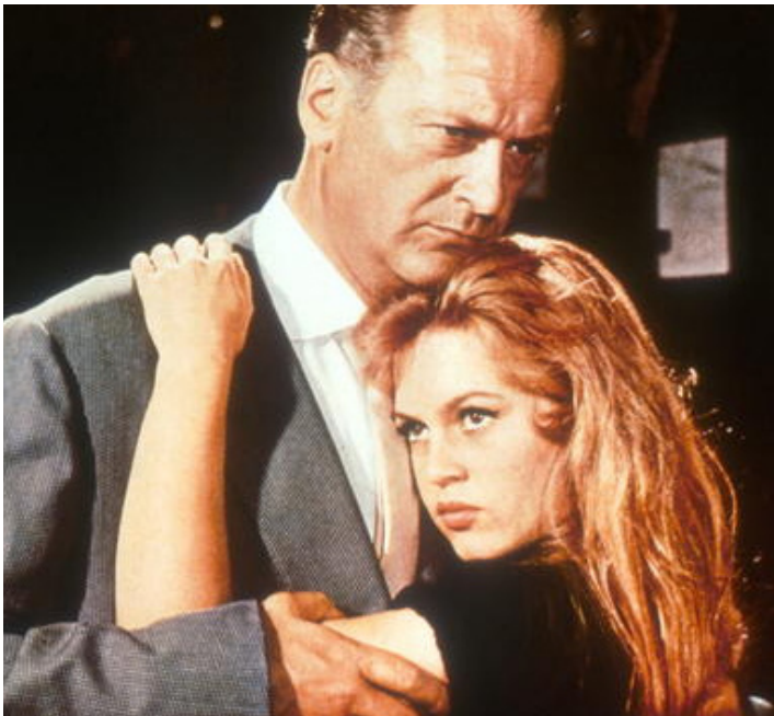
1956 ET DIEU CRÉA LA FEMME de Roger Vadim avec Curd Jürgens