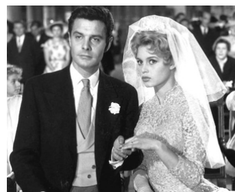
1956 LA MARIÉE ÉTAIT TROP BELLE de Pierre Gaspard-Huit avec Louis Jourdan