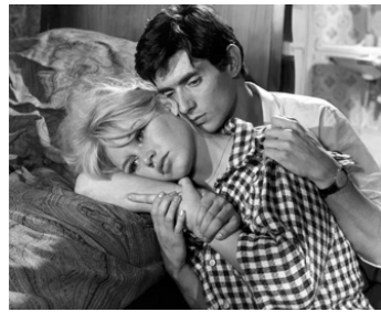
1960 LA VÉRITÉ d'Henri-Georges Clouzot avec Sami Frey