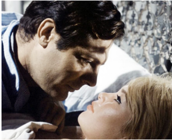
1961 VIE PRIVÉE de Louis Malle avec Marcello Mastroianni