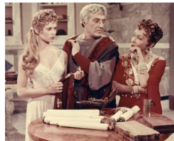
1956 LES WEEK-ENDS DE NÉRON (Mio Figlio Nerone) de Steno avec V. De Sica, G. Swanson