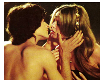
1973 COLINOT TROUSSE-CHEMISE de Nina Companeez avec Francis Huster