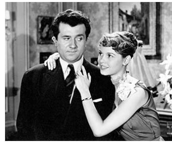
1953 LE PORTRAIT DE SON PÈRE d'André Berthomieu avec Jean Richard