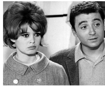
1960 LA BRIDE SUR LE COU de Roger Vadim et Jean Aurel avec Claude Brasseur