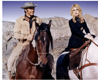
1968 SHALAKO (Shalako) d'Edward Dmytryk avec Sean Connery