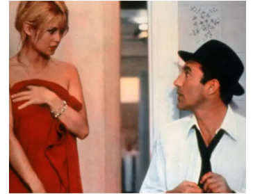
1963 LE MÉPRIS de Jean-Luc Godard avec Michel Piccoli