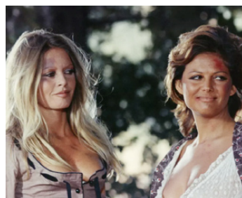
1971 LES PÉTROLEUSES de Christian-Jaque avec Claudia Cardinale