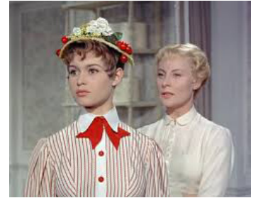
1955 LES GRANDES MANŒUVRES de René Clair avec Michèle Morgan