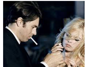
1966 À CŒUR JOIE de Serge Bourguignon avec Laurent Terzieff