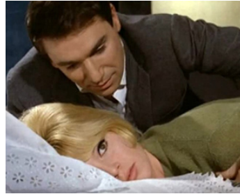
1962 LE REPOS DU GUERRIER de Roger Vadim avec Robert Hossein