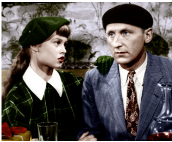
1952 LE TROU NORMAND de Jean Boyer avec Bourvil