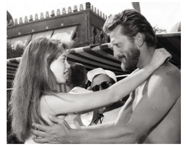
1953 UN ACTE D'AMOUR (Act of Love) d'Anatole Litvak avec Kirk Douglas