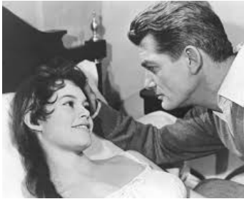
1954 FUTURES VEDETTES de Marc Allégret avec Jean Marais