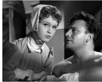
1954 HAINE, AMOUR ET TRAHISON (Tradita) de Mario Bonnard avec Pierre Cresson