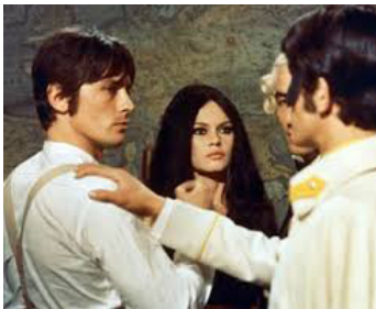
1967 HISTOIRES EXTRAORDINAIRES de Louis Malle avec Alain Delon