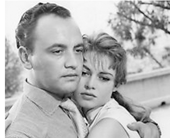
1955 LA LUMIÈRE D'EN FACE de Georges Lacombe avec Raymond Pellegrin