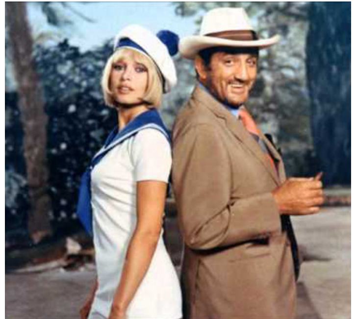
1970 BOULEVARD DU RHUM de Robert Enrico avec Lino Ventura