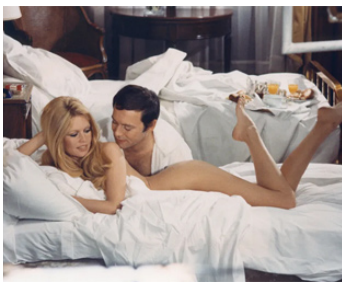
1968 LES FEMMES de Jean Aurel avec Maurice Ronet