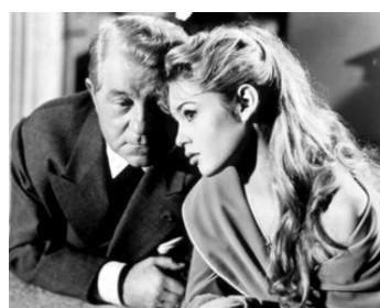
1958 EN CAS DE MALHEUR de Claude Autant-Lara avec Jean Gabin