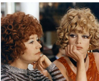
1970 LES NOVICES de Guy Casaril avec Annie Girardot